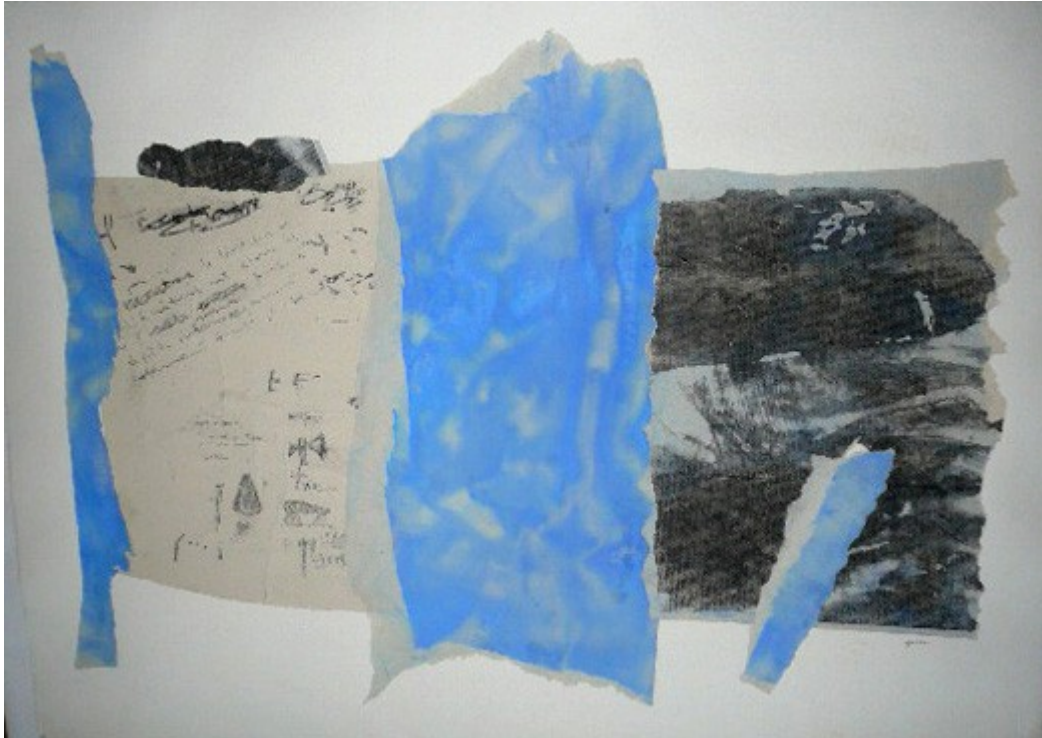
Aquarelle I : collage du fac similié d'un manuscrit de Jean-Marie Laclavetine

Du 15 au 31 décembre 2008 pour ceux qui ont moins de 40 ans 50% sur le prix « atelier » de 800 € soit 400 € l'oeuvre originale