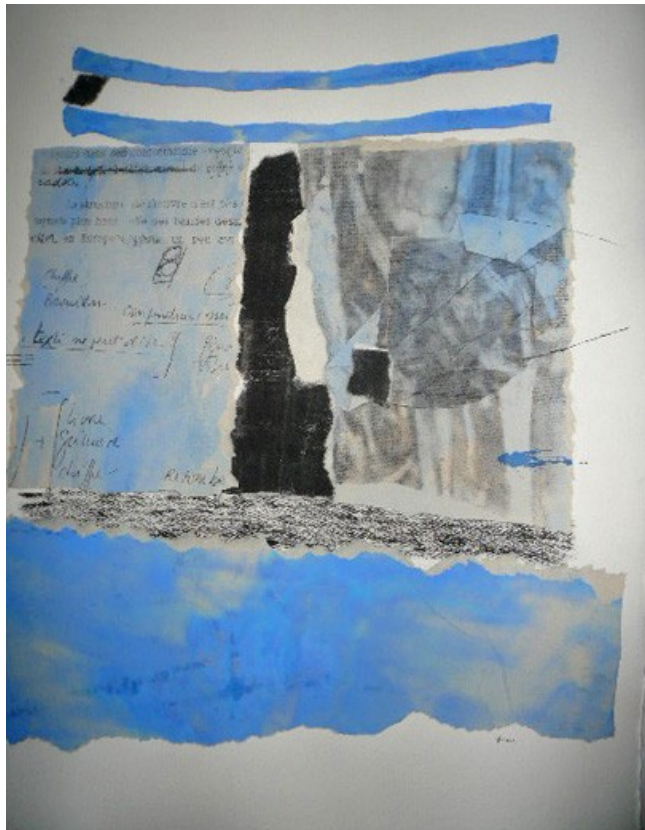
Aquarelle III : collage du fac simulé d'un manuscrit de Pierre Fresnault