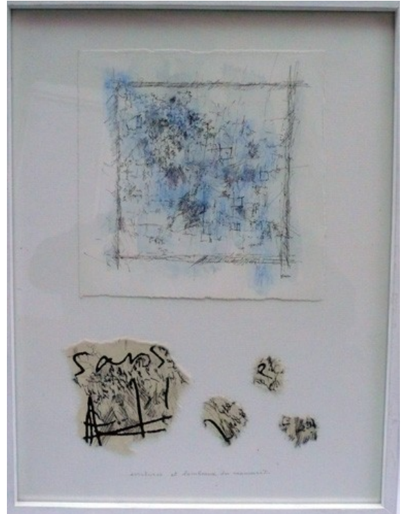
Écritures sur papier aquarelle II, collages lambeaux de manuscrits en fac similés de Jacqueline Held, graphies à la plume aquarellées format 34 x 25 cm

40% sur le prix « atelier » de 350 € soit 210 € l'oeuvre encadrée