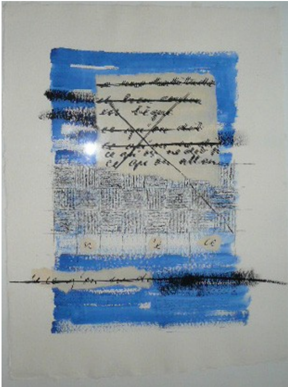
Écritures sur papier aquarelle I, collages lambeaux de manuscrits en fac similés de Claude Held, graphies à la plume aquarellées format 72 x 85 cm 50% sur le prix « atelier » de 950 € soit 425 € l'oeuvre encadrée

Du 15 au 31 décembre 2008 pour ceux qui ont moins de 40 ans