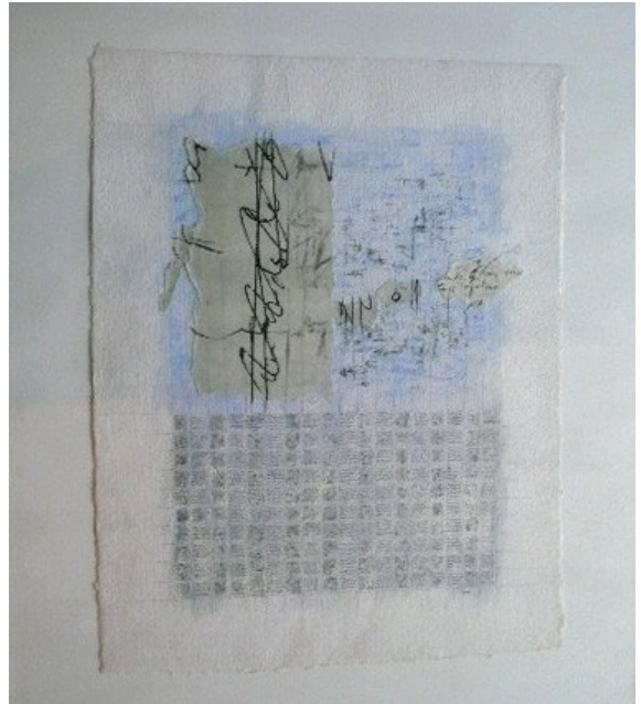
Graphies à la plume II, aquarelle et collage. Encadré