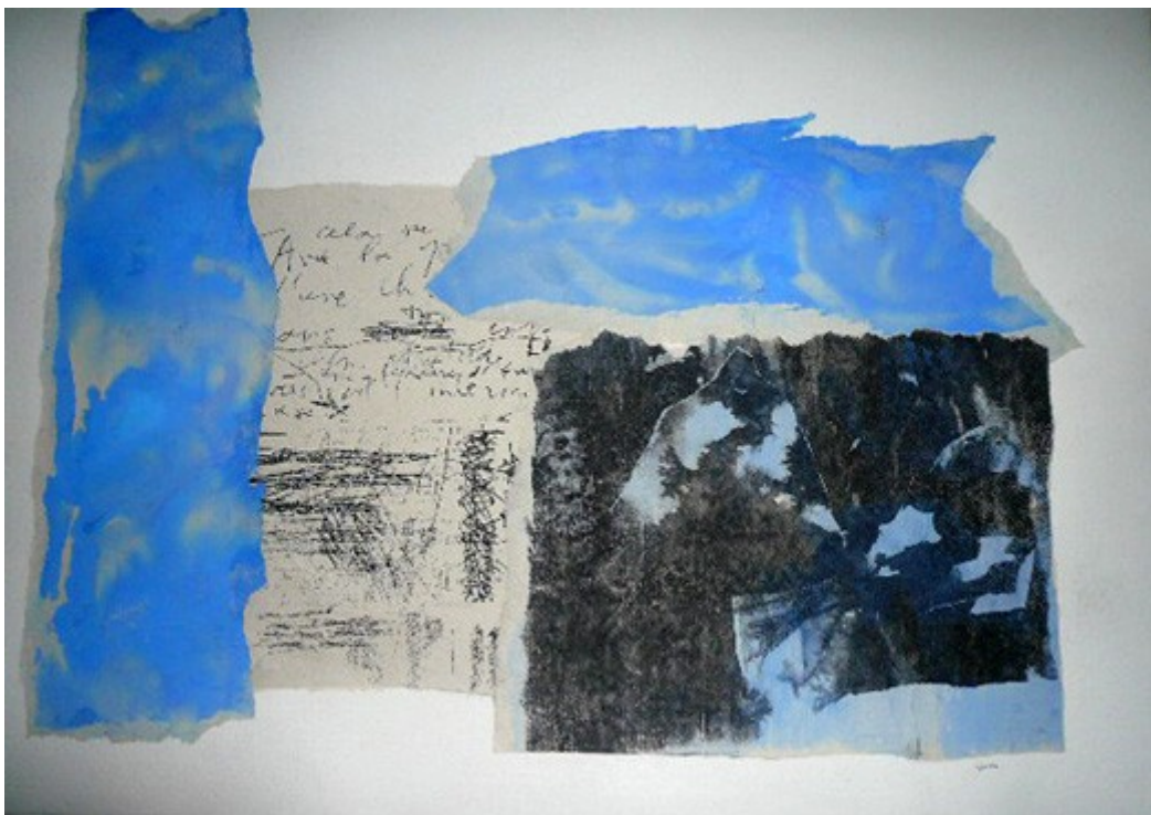
Aquarelle II : collage du fac similié d'un manuscrit de Jacqueline Held