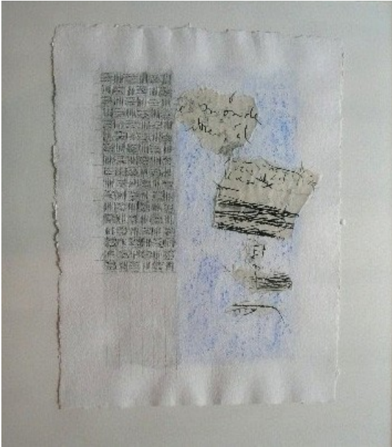
Graphies à la plume I, aquarelle et collage. Encadré

Du 15 au 31 décembre 2008 pour ceux qui ont moins de 40 ans 50% sur le prix « atelier » de 950 € soit 425 € l'oeuvre encadrée